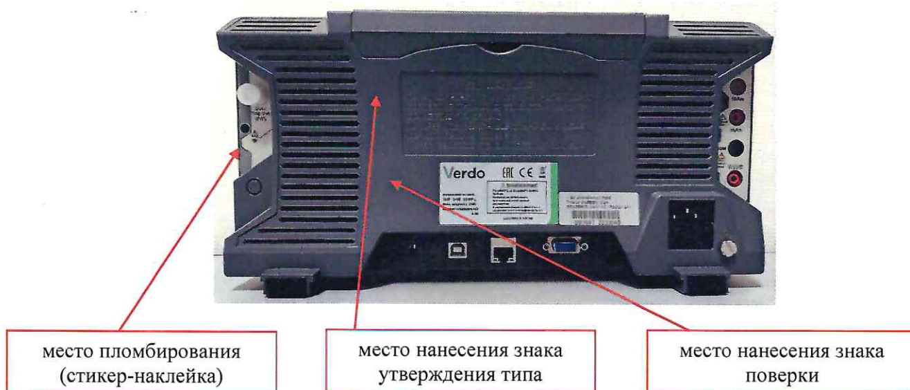
Рисунок 2 – Общий вид осциллографов, задняя панель