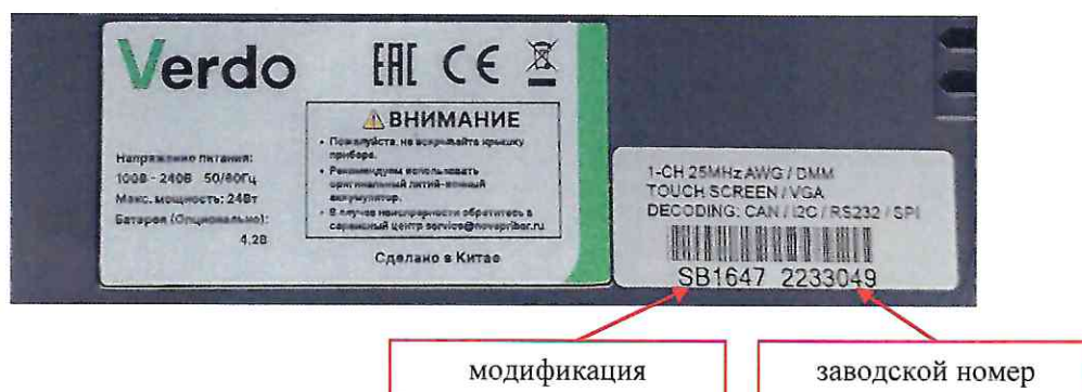
Рисунок 3 – Фрагмент задней панели осциллографа с этикеткой