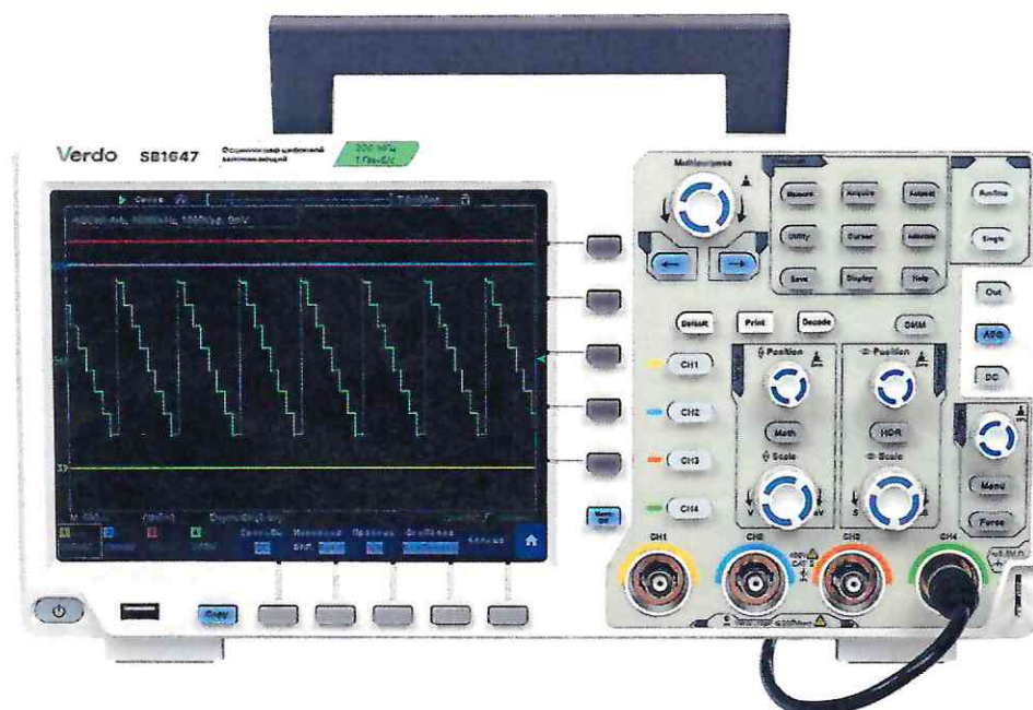
Б) модификации SB1421-SB1647 четырехканальная версия